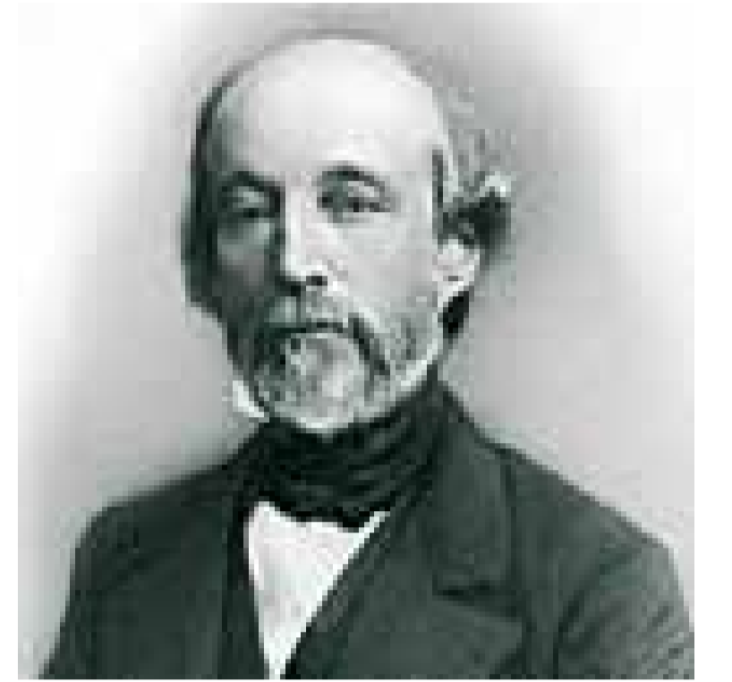
Alfred de Falloux