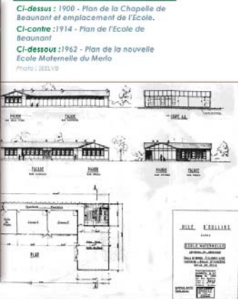
Ci-dessus : 1900 - Plan de la Chapelle de Beaunant et emplacement de l'école. Ci-contre : 1914 - Plan de l'école de Beaunant Ci-dessous : 1962 - Plan de la nouvelle École Maternelle du Merlo