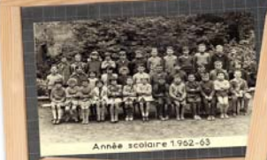
Année scolaire 1962-63

Vous vous reconnaissez ou vous reconnaissez une personne sur ces photos ? Un recueil se trouve à votre disposition à l'entrée de l'exposition, n'hésitez pas à le compléter.