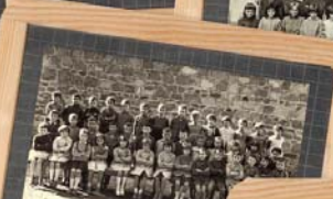
ANNEE SCOLAIRE 1961