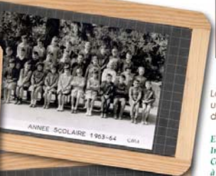
ANNEE SCOLAIRE 1963-64 CMA

Vous vous reconnaissez ou vous reconnaissez une personne sur ces photos ? Un recueil se trouve à votre disposition à l'entrée de l'exposition, n'hésitez pas à le compléter.