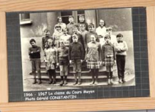
1964 - 1967 - Les classes du Cours Moyen