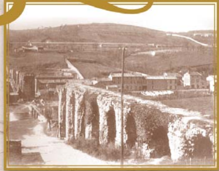
Vers 1910-1920 - Beaunant vue de Sainte-Foy. L'Yveron occupe le fond du vallon. Une passerelle submersible rejoint Beaunant. A droite, l'ancienne baculière KU.

Par la suite, à l'emplacement de l'actuel Vulco, une partie du terrain sud-est a été cédée pour la construction de l'Ecole Maternelle, rattachée à l'Ecole Inter-communale de Beaunant.