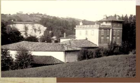
1959 - Avant la construction des maisons des Castors vue du « Château » depuis la future propriété CHAVANEL (N°26)