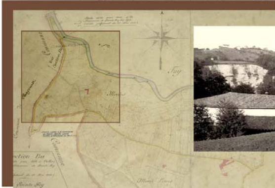
Carte du site géographique du quartier du Merlo et portrait des modifications postérieures à 1971. Au centre de la zone encadrée, l'ancienne propriété GAUTIER devenue les FRANCAS puis TEMPS JEUNES.