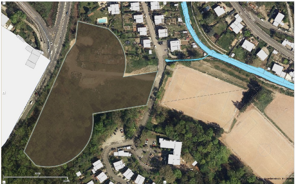
Localisation et emprise de la parcelle AB228.